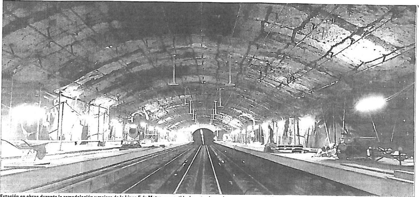
Estación en obras durante la remodelación y mejora de la Línea 5 de Metro, acometida durante el pasado verano, y que reabrió este mes de septiembre.